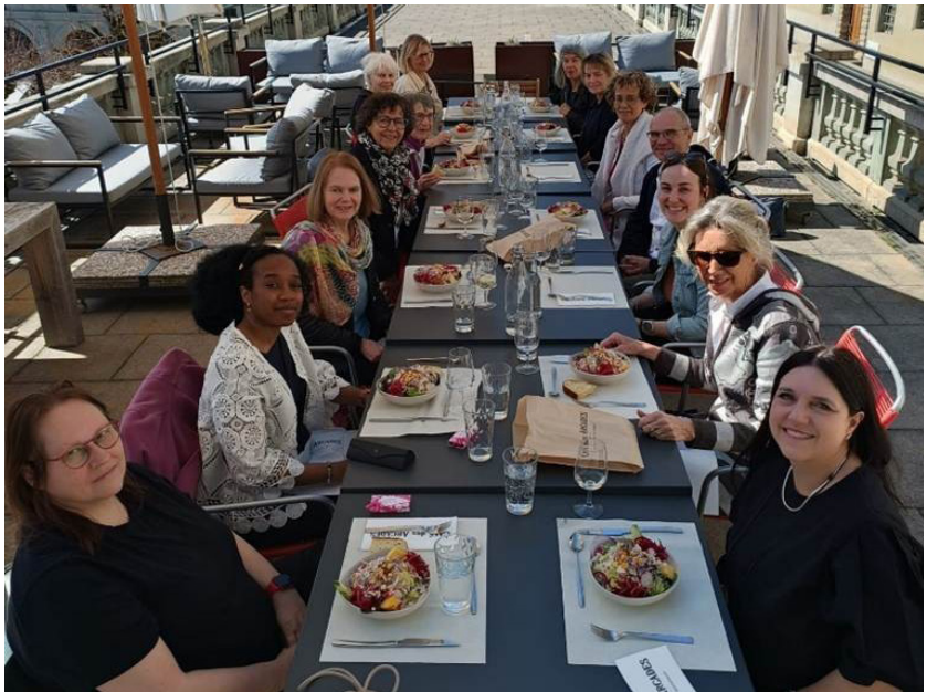
Frühlingsausflug SP Frauen